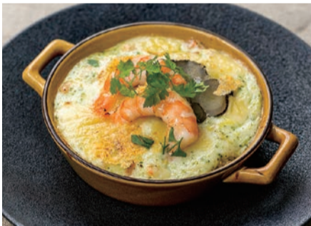
土香るごぼうと ハーブシュリンプのチーズドリア

土ごぼうたっぷりのバターライスにハーブシュリンプの旨味をギュッと詰めたホワイトソースは絶品です。