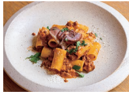
合鴨とボルチーニのラグー トマトクリームのリガトーニ

太い筒状のショートパスタ“リガトーニ” 味わい深い合鴨の煮込みをトマトクリームのソースで!