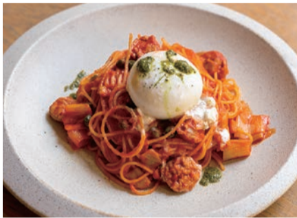
サルシッチャと白ネギの トマトスパゲッティ ブッラータチーズ乗せ

中からクリームが溢れ出すかわいい見目のブッラータチーズ。温かいパスタと絡めてお召し上がりください。