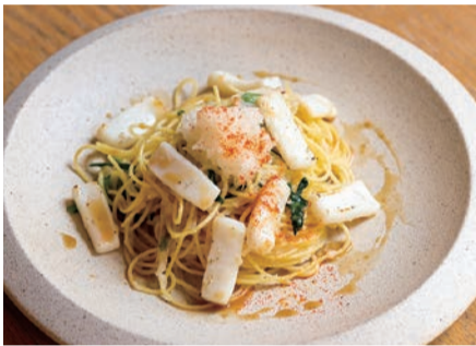
旬のヤリイカと春菊の みぞれ風スパゲッティ ポン酢餡ソース

肉厚のヤリイカにポン酢と柚子胡椒の香り。みぞれ煮にしたあっさりオイルパスタです。