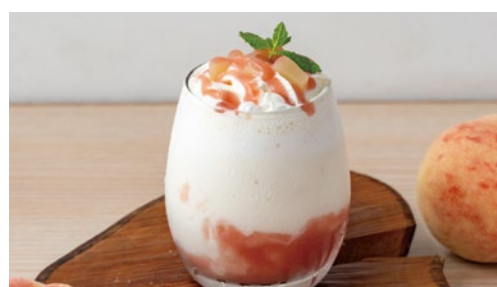
ピーチヨーグルトスムージー