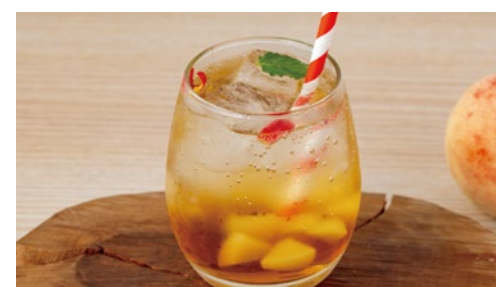
桃とアールグレイのティーソーダ