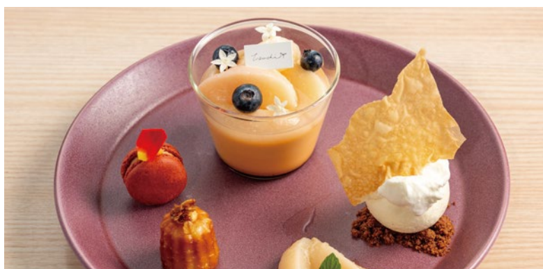
桃のプリンアラモード

濃厚な自家製チーズタルトにコンポートした桃、自家製のディプロマットクリームを合わせました。