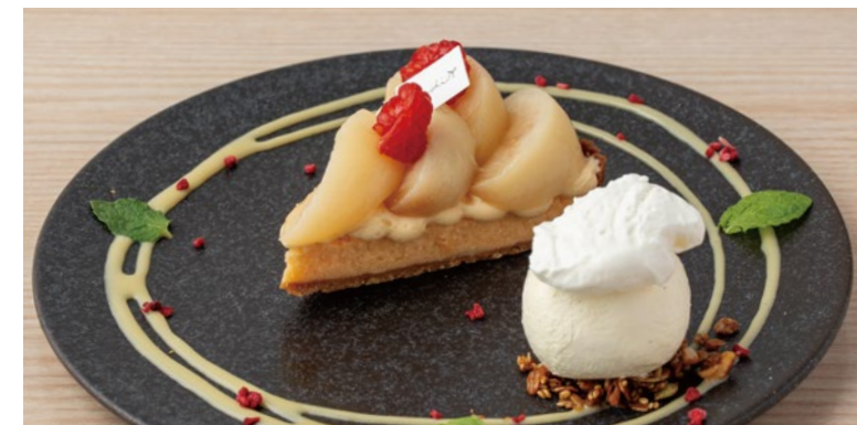
桃のチーズタルト