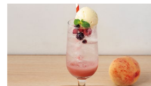
ピーチ&ベリーフロート